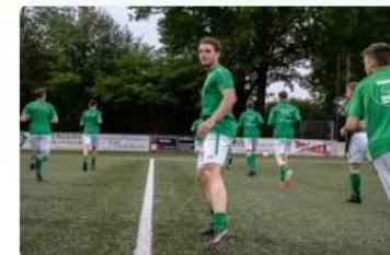
AD Deze amateurclub trainde dit jaar p...