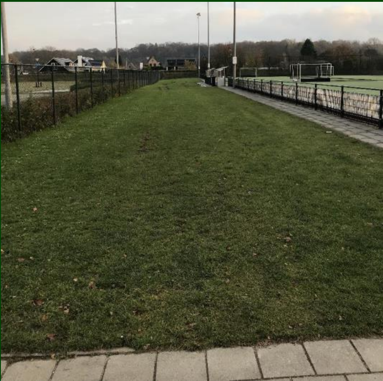
Living Lab Venlo