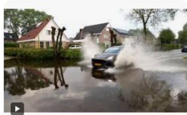
NOS Wateroverlast door zware regenval, str...