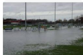
Brabants Dagblad Hevige regenval zet wegen en voet...