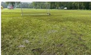
Omroep Brabant Tot de enkels in het water: voetbaltoern...