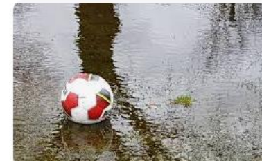
Stadskrant Veghel 2H: Vianen Vooruit – EVVC ontmoeting...