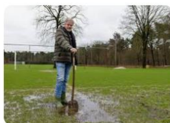
Eindhovens Dagblad Enorme plassen maken voetballen i...