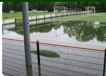
www.sportveld.nl Wateroverlast kunstgras of gras sp...