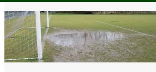
Sportbelijning Sportveld en sportondergrond: kunstgras versus natu...