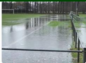
BN DeStem Zorgen over natte velden Lepelstr...