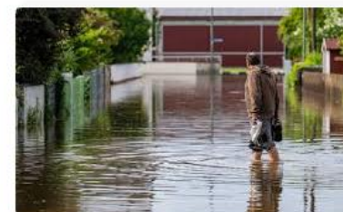
NU Duitsland evacueert meerdere dorpen i...