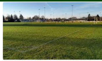
Fieldmanager Lava in een sportveld: sporttechnisch fant...