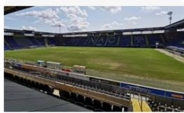
Sportvelden.info NAC pakt velden groots aan