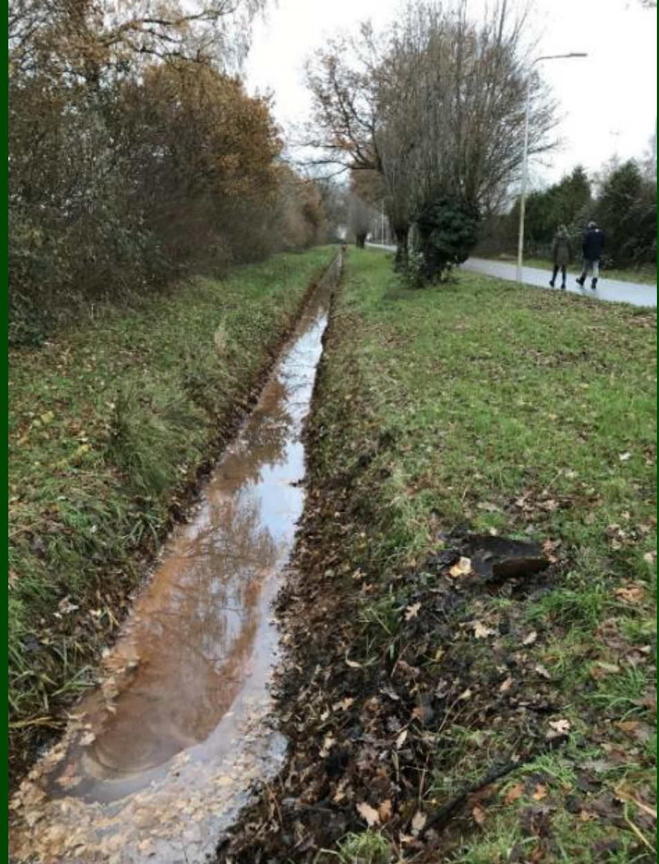
Living Lab Zwolle