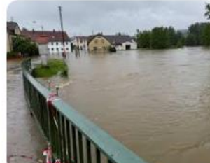
NOS Wateroverlast, overstromingen ...