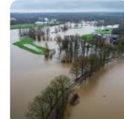
de Volkskrant Veel wateroverlast in o...