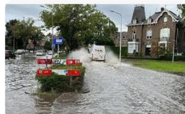
NOS Wateroverlast in Limburg en Brabant, s...