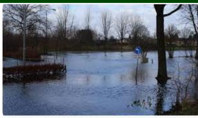
Omroep Brabant Sportvelden en parkeerplaats bij verenigin...