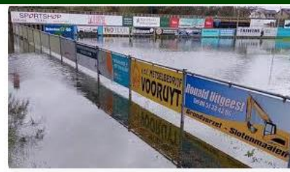
Regio Noordkop Geplande uitwedstrijd Texel valt in het wat...