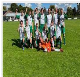
Omroep Eindhoven Voetbalclub Vlieland stapt uit competitie va...