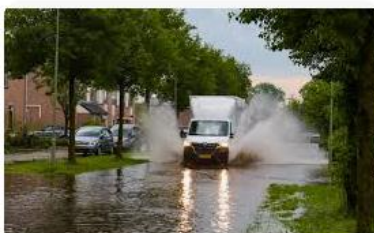
NOS Wateroverlast door hevige buien, weer...