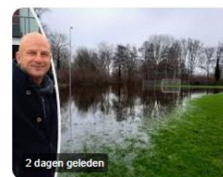
de Stentor Opmerkelijk probleem voor voet...